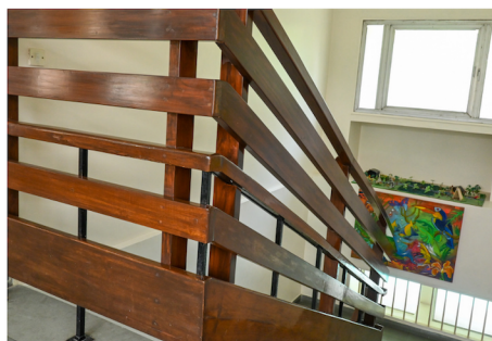
AMÉLIORATIONS DE LA SÉCURITÉ