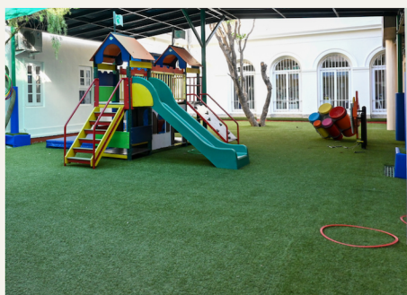
COURS DE MATERNELLE