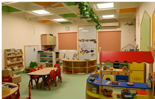
LA CLASSE DE TPS