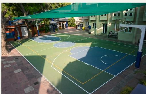
TERRAIN DE BASKETBALL